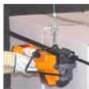
Stationär bandning med upphångningsanordning

Med reservation för ändringar i produktspecifikation